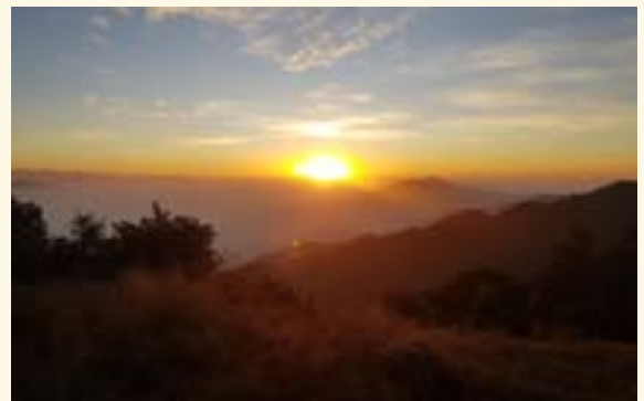
भूमिचुलीबाट देखिएको सूर्योदय

प्रख्यात धार्मिकस्थल भूमिचुली मन्दिर वडा नम्बर ९ मा पर्छ । भूमिचुलीलाई तामाङ भाषामा ज्योमोगाङ भनिन्छ । गाउँमा खडेरी परेका बेला २३ सय मिटर उचाइमा रहेको भूमिचुली मन्दिरमा प्रत्येक घरधुरीबाट एक एकजना पुगेर पानी माग्दै पूजा गर्ने चलन छ । उनीहरू फर्केर आफ्नो घर नआइपुग्दै ठूलो पानी पर्ने गरेको अनेकौं उदाहरण