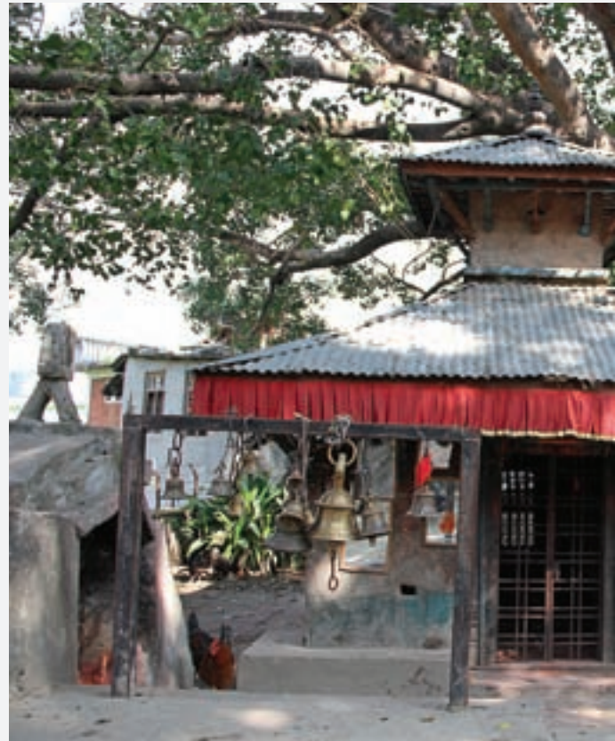
ऐतिहासिक मास्ती भीमसेन मन्दिर

मल्लकालमा भक्तपुरकी राजकन्यासँग दोलखाका राजकुमारको बिहे भएछ । भक्तपुरका राजाले छोरीका साथ एक मोटाघाटा बलिया ज्यापूलाई पनि सेवकको रूपमा पठाएका थिए । असारको बेला रहेछ । रोशीमा ठूलो बाढी आएकाले उनीहरू वारि मास्ती टारमै बास बसेछन् । तल नदीमा पानीको बाढी आए पनि सुक्खा मास्ती टारमा भने पानीको अभावमा रोपाइँ भइरहेको थिएन । आकाशको पानी पर्खिरहेका थिए । भक्तपुरे ती ज्यापूले वायुदेवताको आराधना गरी पानी बर्साइदिए ।