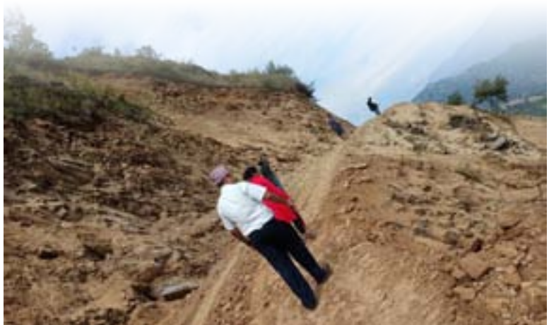
सडक अनुगमनमा उपाध्यक्षसहितको टोली

पालिकामा न्यायिक समितिका साथै अनुगमन समिति, राजस्व परामर्श समिति, बजेट तर्जमा समिति र गैरसरकारी तथा अन्तर्राष्ट्रिय संघसंस्थासँगको समन्वय समितिको मुख्य जिम्मेवारी उपप्रमुखकै काँधमा छ। नेपालको इतिहासमै पहिलोपल्ट