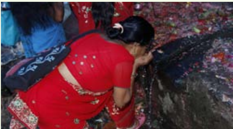
१२ वर्षमा मात्र मूल फुट्ने गोदावरी धारामा दर्शन गर्दै श्रद्धालु महिला

रामायणकालमा सीताको पवित्र पाइला परेको चिह्न अंकित ढुंगा, महाभारतको लडाइँमा सेनाहरू चढी आएका हात्तीलाई पानी खुवाउने र आहल राख्ने हात्तीआल, कुनै कालखण्डमा पुच्छ्रेतारा खसेर डाँडाको टुप्पोमा बनेको पानी पोखरी, १२ वर्षमा मात्र फुल्ने अनौटो