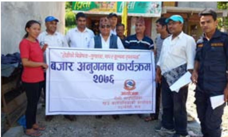
बजार अनुगमन कार्यक्रममा गाँउपालिकाको टोली

रोशी गाउँपालिकाको वडागत रूपमा हेर्ने हो भने १, २ र ३ को भूगोल मिलेको छ। सम्म पनि छ। तरकारी खेतीको प्रचुर सम्भावना छ। ४ नं वडामा अहिले पनि घर घरमै खुवा बनाउँछन्। ५ नं वडामा कृषि पशुपालन नै बढी देखिन्छ। ६ नं वडामा २ वटा पाटा छन्। एउटा पाटामा पशुपालनको एकदमै सम्भावना छ। अर्को पाटामा तरकारी फलफूललागायत खाद्यान्न उत्पादनको सम्भावना छ। ७ नं वडालाई बीपी हाइवे ले दुई भागमा विभक्त गरेको छ, त्यहाँ पर्यटन उद्योग एवं व्यापारको विकास गर्न सकिन्छ। रोशीको चिसो पानी प्रयोग गरी मत्स्यपालन गर्न सकिन्छ। ८ नं वडामा पनि कृषि र पशुपालनको सम्भावना छ। ९ नं वडा ठूलो छ, बजार र फाँटहरू धेरै छन्। भूमीचुलीजस्ता अग्ला पर्यटकीय डाँडाहरू छन्। त्यहाँ भ्युटावरहरू बनाउने कार्यक्रम छ। वडा नं १० खाद्यान्न तथा जडीबुटीका लागि प्रचुर सम्भावना भएको ठाउँ हो। ११ नं वडामा ढुंगा, गिटी, बालुवाको प्रचुर सम्भावना छ। सार्वजनिक जग्गाहरू पनि प्रशस्त छन्। १२ नं वडाको माथिल्लो भेकले पदयात्रा पर्यटनको प्रचुर सम्भावना बोकेको छ। जडीबुटीको खेती गर्न सकिन्छ। बीपी राजमार्गका यात्रुहरूलाई रोशी गाउँपालिकाको १८ किलोमिटर खण्डमा एक दुई घण्टा अड्याउन