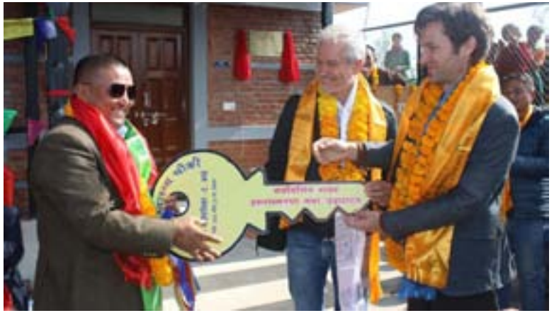
स्वास्थ्य चौकी हस्तारण कार्यक्रममा भवनको साँचो बुझ्दै अध्यक्ष लामा

हुन पनि मुलुकका अधिकांश जिल्ला पूर्ण साक्षर घोषणा भइसकेका छन्, तर राजधानी काठमाडौंसँगै जोडिएको, मुलुककै दोस्रो विश्वविद्यालयसमेत रहेको काभ्रे जिल्ला पूर्ण साक्षर घोषणा हुन बाँकी छ । यसरी बाँकी रहनुमा मुख्य कारक भनेको रोशी गाउँपालिका हो । अरू गाउँपालिका पूर्ण रूपमा साक्षर छन्, तर रोशीमा अझै पनि १० प्रतिशत निरक्षर छन् ।