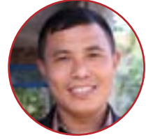
दूधराज तामाङ वडा नम्बर १०

साबिकको वाल्टिङ गाविसलाई वडा नम्बर १० कायम गरिएको छ । बीपी राजमार्गले नछोए पनि वडाको अधिकांश क्षेत्र सुगम छ । शैक्षिक क्षेत्रमा पनि यो वडा तुलनात्मक रूपमा अघि छ । ९० प्रतिशत साक्षर छन् । बीपी राजमार्गबाट दुई किलोमिटरदेखि १२ किलोमिटरसम्मको दूरीमा यो वडाका गाउँहरू छन् । तर सडक भए पनि वर्षायाममा बस चल्न सक्दैन ।