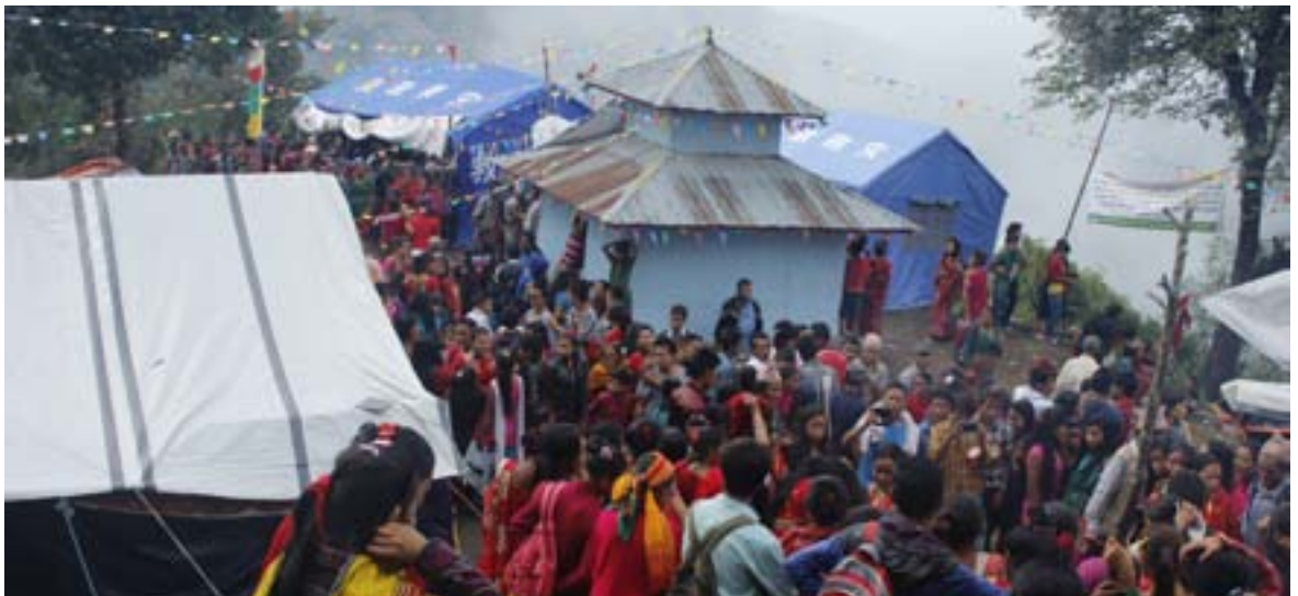
१२ वर्षमा लाग्ने गोदावरी मेला

काठमाडौँ उपत्यका र तत्कालीन तिरुहत राज्यलाई जोड्ने व्यापारिक मार्गअन्तर्गत रोशी पनि हो । काठमाडौँबाट पूर्वी प्रदेश र दक्षिण पूर्वी मैदान छिचोल्ने मार्ग वर्षातमा तिमाल डाँडैडाडा र हिउँदमा रोशी खोलाको बगरैबगर दुम्जा भएर सुनकोसीको किनारैकिनार खुर्कोट पुगेर सिन्धुली र ओखलढुंगातिर लाग्दथ्यो । मध्यकालमा काठमाडौँ उपत्यकामा बंगाली फौज पूर्वकै बाटो भएर आएको थियो ।