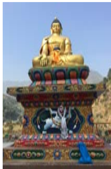
वीपी राजमार्गमा रहेको बुद्ध प्रतिमा

वडा नम्बर ९ मा ५८०० जनसंख्या तथा २७०० मतदाता छन् । जनसंख्याको हिसाबले रोशी गाउँपालिकाको सबैभन्दा ठूलो वडा हो यो । मावि दुई वटा र ६ वटा आधारभूत गरी यस वडामा आठवटा विद्यालय छन् । करिब ७० प्रतिशत तामाङ जाति रहेको यो वडामा क्षेत्री, बाहुन, नेवार, मगर, दलितलगायतको बसोबास छ । पुरानो व्यापारिक केन्द्र मंगलटारमा पहिले नेवारहरूको बाक्लै बस्ती थियो ।