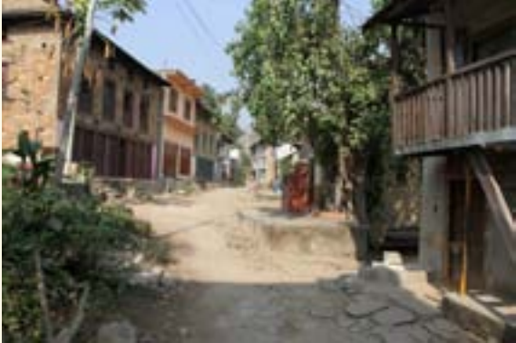
ऐतिहासिक मंगलटारको सुनसान बजार

लमजुङको घलेगाउँ, तनहुँको बन्दीपुरजस्तै विगतमा समृद्ध, तर अहिले उजाड मंगलटार बजारको ऐतिहासिक बजारलाई पुरातन शैलीकै भक्तिको दिने गरी आधुनिक रूपमा विकास गर्न सकिन्छ । भएका घरहरूको पुनर्निर्माण वा सुधार गरेर पुरानै शैली कायम रहने गरी आधुनिक बस्तीका रूपमा मंगलटारलाई विकास गर्न सकिने यथेष्ट